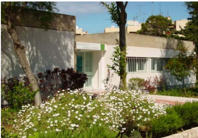
Une vue du Centre

Le logement et l'assurance sont à la charge du candidat.