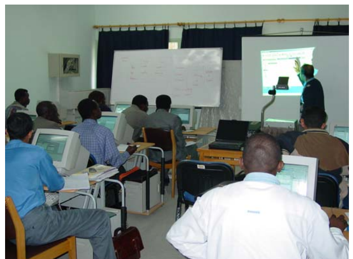
Un cours au Centre